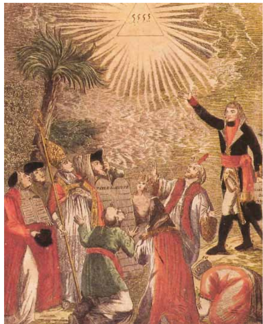
L'immagine, del 1799, mostra Napoleone che nominato Primo Console addita l'essere supremo ai rappresentanti di tutte le religioni, a simboleggiare la libertà concessa a tutti i culti religiosi.

Negli Stati italiani dell'ultimo decennio del Settecento gli ebrei vivono ancora, dove sono presenti, chiusi nei ghetti, sottoposti a molteplici restrizioni e in una condizione codificata di subordinazione e inferiorità.