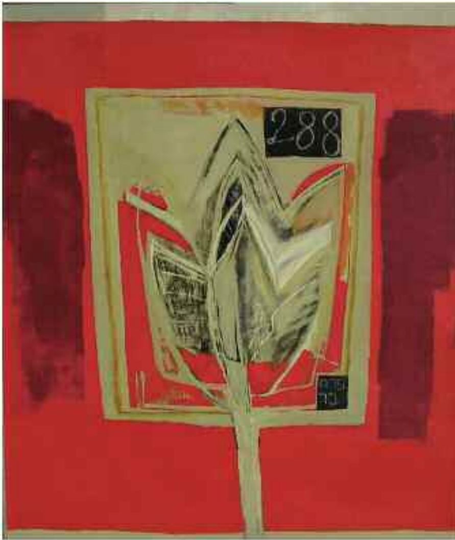
Tulipano 60x70 cm acrilici su tela 2004