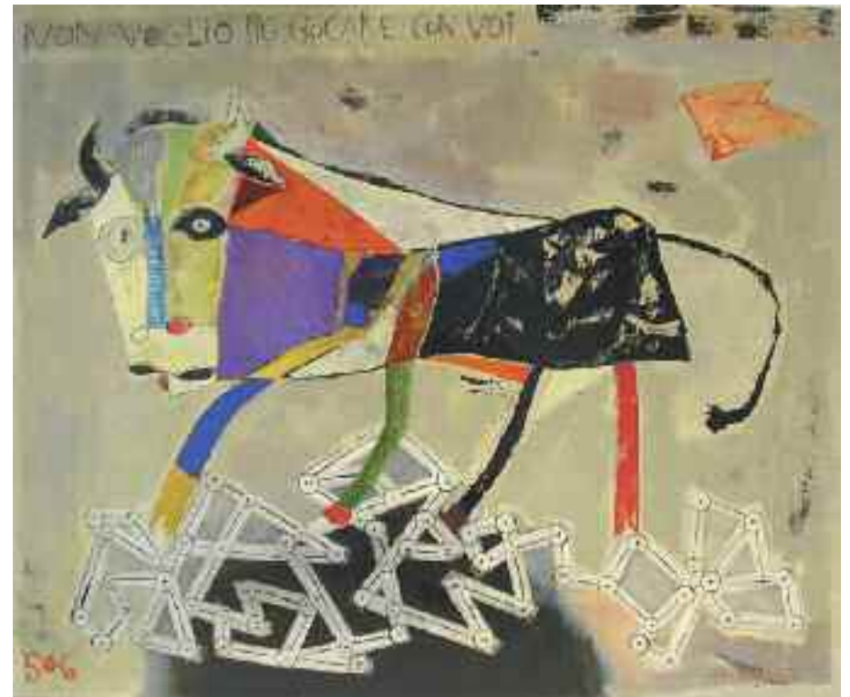
Non voglio più giocare con voi 100x80 cm acrilici su tela 2005