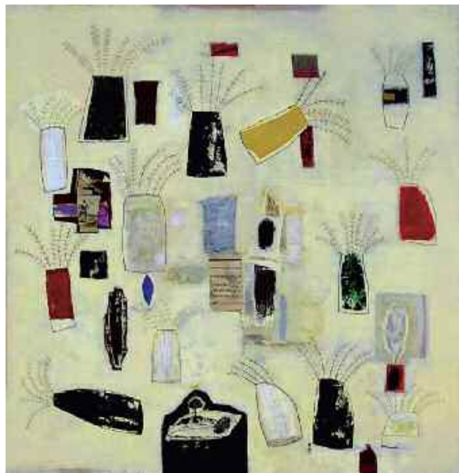
Il giardino dell'innocenza 100x100 cm acrilici e collage su tela 2007