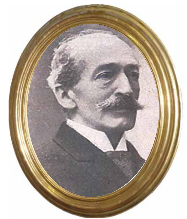
Ugo Pisa (Ferrara 1845 - Milano 1895)

Altra famiglia illustre fu quella che fondò la ditta Zaccaria Pisa dal nome del fondatore. Trasferitasi progressivamente da Ferrara a Milano intorno al 1853-55, la ditta divenne una delle più importanti banche private italiane. Il nipote di Zaccaria, Ugo Pisa , figlio di Luigi Israele, presidente della Banca Lombarda di depositi e conti correnti, combatté con Garibaldi nel 1866, fu uno dei più attivi sostenitori della Società Umanitaria e il più importante azionista del giornale democratico "Il Secolo" di Milano. Liberale radicale fu nominato senatore.