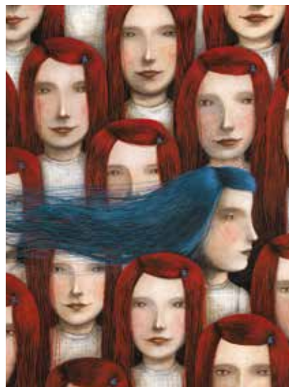
Ofra Amit | Sea #4 | tecnica mista | 2010

Le tavole presenti in mostra guideranno i visitatori in un viaggio attraverso il genio creativo e la sostanza emozionale di un Paese dalle molteplici sfaccettature, che può a pieno titolo inserirsi tra i protagonisti dell'editoria internazionale per la sua vitalità e il suo grande fermento innovativo.