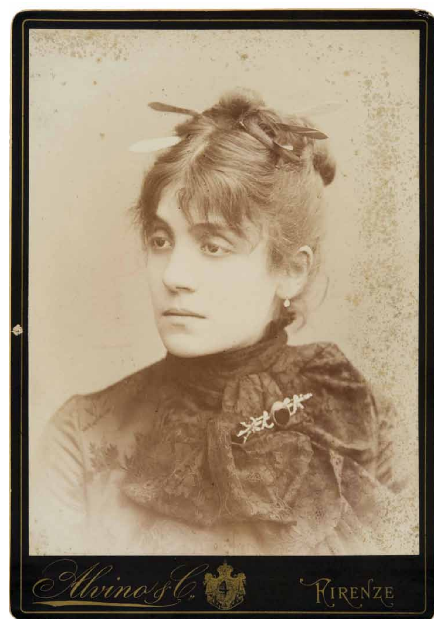
Ritratto di Eleonora Duse , circa 1890: "Apparsa in un pomeriggio di sole al Poggiolino, lo riempì di tutto il suo fascino, e Laura ne fu presa, interamente".

fu ben accolto e si creò un comitato per organizzare le rappresentazioni, riadattare il teatro, scegliere le compagnie e quanto necessario.