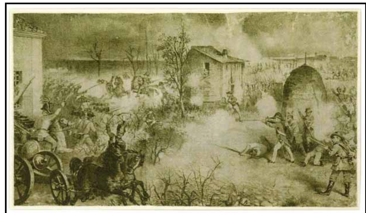
25 marzo 1831, fatto d'armi avvenuto presso Rimini: nel drappello di soldati, che cercò di contrastare l'avanzata austriaca, si contavano una ventina di volontari ebrei. Litografia di Cesare Mauro Trebbi, 1850 ca. - Faenza, Museo del Risorgimento e dell'Età contemporanea

All'arrivo delle truppe napoleoniche in Italia nel 1796, che porta ad affermare il dominio della Francia su tutte le provincie della penisola, la comunità ebraica di Ferrara nella Legazione pontificia è la prima a essere liberata, seguita dalle comunità di Bologna e di Modena.