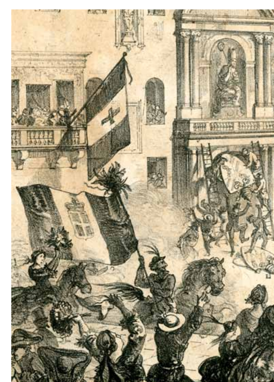
1859, festeggiamenti a Bologna per la fine del dominio temporale della Chiesa